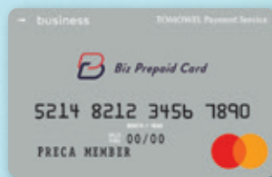
Mastercard®付き法人プリペイドカード 見本